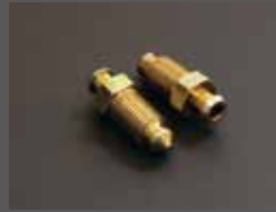
エア抜きニップル