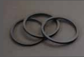
キャリパー・ワイパーシール