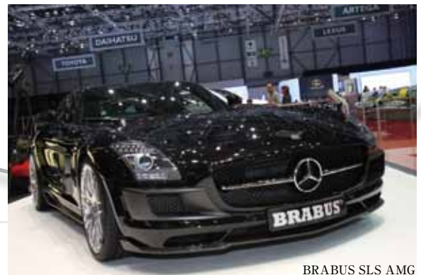
BRABUS SLS AMG