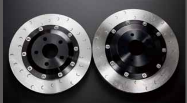
ブレーキローター