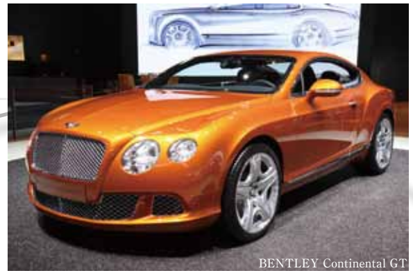
BENTLEY Continental GT

イギリスに本拠地を置くアルコンは、1984年にジョン・ムーアにより設立された。元APのエンジニアであり、レーシングドライバーでもあった彼は、技術者、ドライバーの両面で多くのモータースポーツに関わってきた。その後アルコンを創り、深く顧客のニーズを聞き、それに応えるブレーキパーツを提供することを一貫して行なってきた。これこそが、今でも変わることのないアルコンの最大の特徴。どの車種、カテゴリー、走行ステージであってもユーザーからオーダーされた要望に対する確かなパーツ提供とアドバイスをすることが信念となっている。