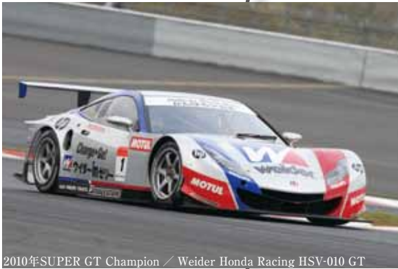
2010年SUPER GT Champion / Weider Honda Racing HSV-010 GT