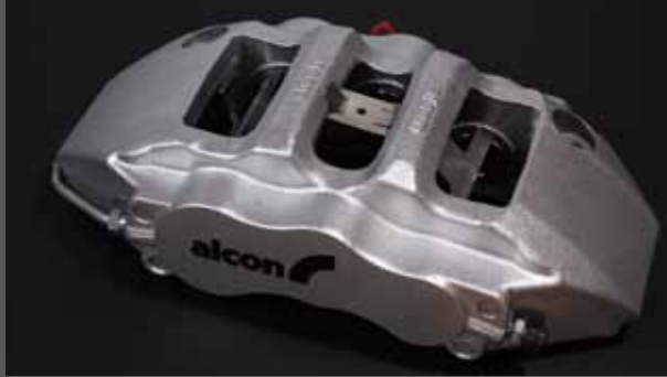
ブレーキキャリパー